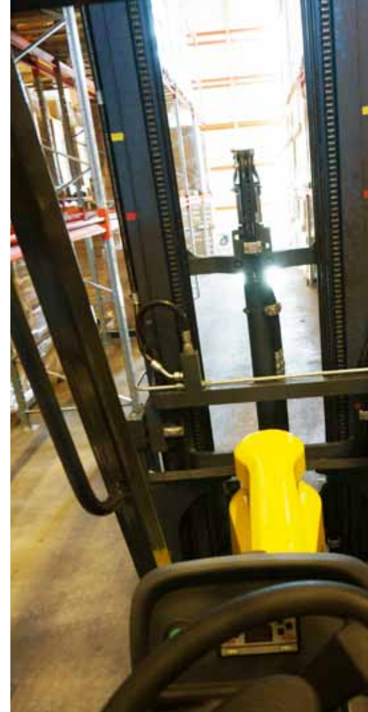
Sikten är viktig precis som vid alla annan truckkörning.

Kinnan-gruppen, som Entrade ingår i, har två separata lager intill varandra. Kinnan är noga med att hantera de olika varugrupperna, värmepumpar och installationstillbehör, var för sig. Kinnan är nämligen agent för värmepumpstillverkarna Panasonic och LG, och tillbehören