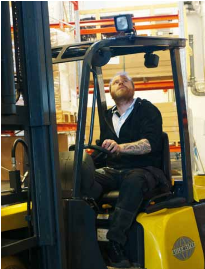
Sikten är viktig precis som vid alla annan truckkörning.